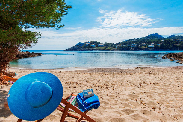
Playa (muy cerca)