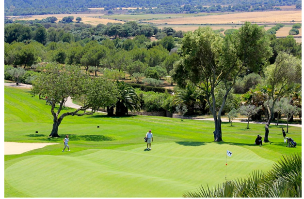
Golf Canyamel (muy cerca)