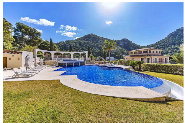
Swimmingpool A (Gemeinschaft)