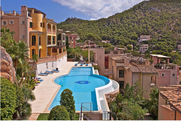
Swimmingpool C (Gemeinschaft)