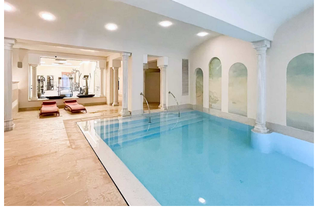
Swimmingpool B (Gemeinschaft)