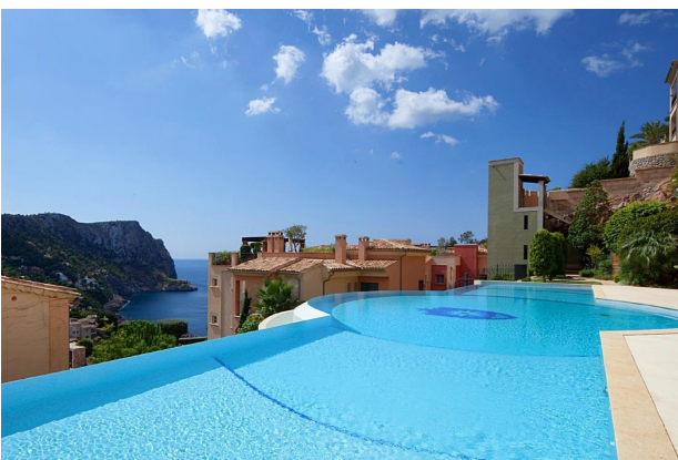
Swimmingpool C (Gemeinschaft)