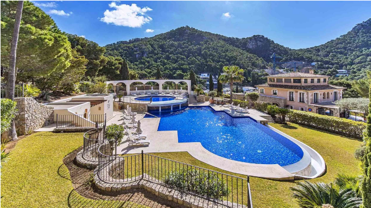
Swimmingpool A (Gemeinschaft)