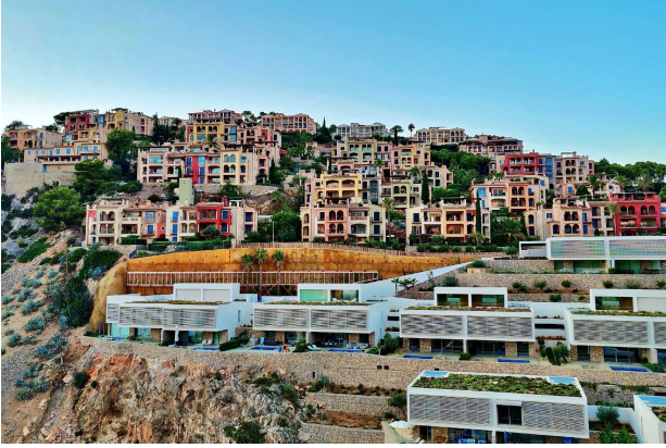
Gran Folies / New Folies (Gemeinschaft)