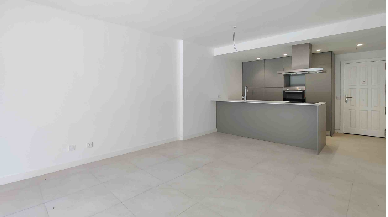
Wohnen / Küche