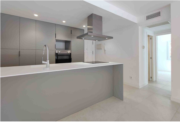
Küche / Flur