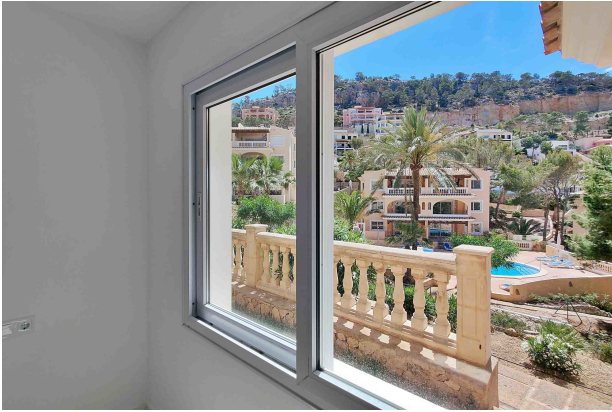
Blick (Schlafzimmer 1)