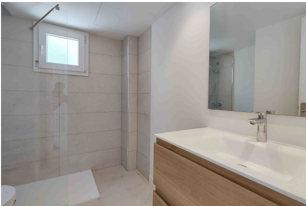
Bad 1 (en Suite)