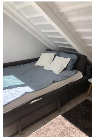
Schlafzimmer 4 (2.OG)