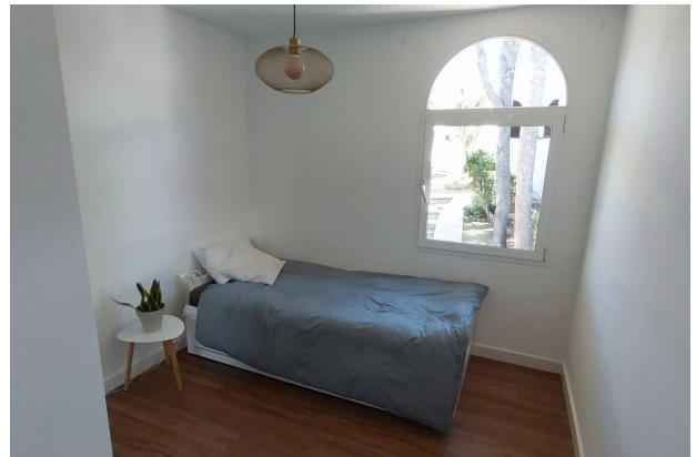
Schlafzimmer 2 (1.OG)