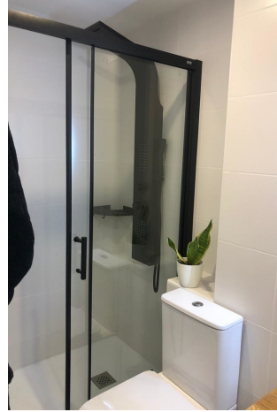
Badezimmer 2 (1.OG)