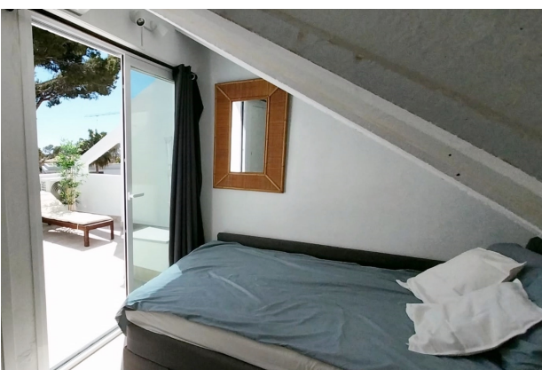
Schlafzimmer 4 (2.OG)