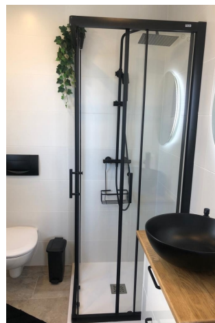
Bad 1 en Suite (1.OG)