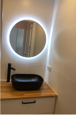
Bad 1 en Suite (1.OG)