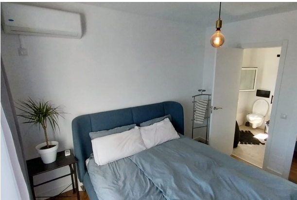
Schlafzimmer 1 (1.OG)